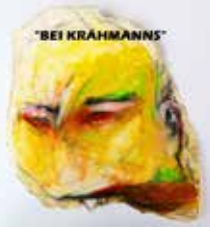
... im Kopf

klauskossak "Det drägt 'de Katze uff'n Schwanz ... (... so wenig)"