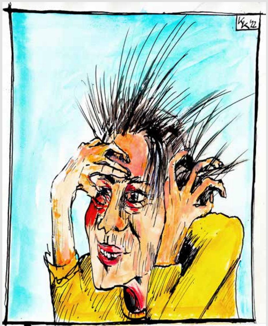
Klaus Kossak Copyright KK © | www.klaus-kossak.de

Noch eins: mir ist aufgefallen, dass es manchen Zuschauer schwer fällt, unangemessene Kritik an den eigenen Spielern lautstark zu äußern. Das ist keine Fankultur, sondern desaströses Verhalten den Spielern wie Trainern gegenüber. Ich wünsche dem neuen Trainer von SV Emsdetten 05 in diesem Sinne die Unterstützung, die er mit dem Team verdient.