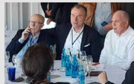
Viel Prominenz in der Schalcker Glück-Auf-Kampfbahn beim Abschiedsspiel für Werner Hansch – (v.l.) Rainer Calmund, Clemens Tönnies und Uli Hoeneß