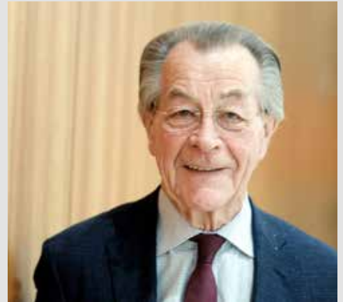
Ex-Vizekanzler Franz Müntefering

1940 in Neheim/Arnsberg, darf man gestrost als Urgestein der Sozialdemokraten bezeichnen. Er war in den Jahren von 2005 bis 2007 Vizekanzler der Republik, gehörte in den Jahren 1975 bis 1992 sowie von 1998 bis 2013 dem Deutschen Bundestag an, fungierte in den Jahren von 1996 bis 1998 als Bundesminister für Verkehr, Bau- und Wohnungswesen im ersten Kabinett Schröder. Nach zwei Amtsperioden stellte er sich als Partei-Vorsitzender nicht mehr zur Wahl.