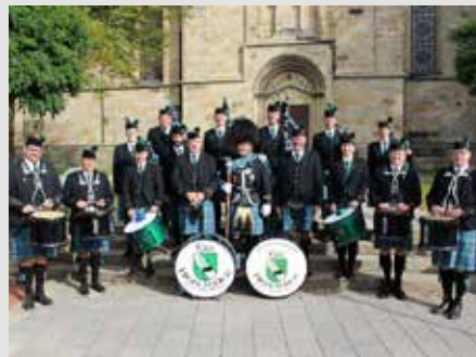
Die Emsland Highlander Pipes and Drums werden vor dem Spiel und in der Halbzeit im Stadion für tolle Stimmung sorgen.

le Jahre ein toller Hallensprecher beim Handballzweitligisten TVE.